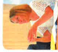
Hélène Bernard, rectrice de l'académie de Toulouse, chancelière des universités